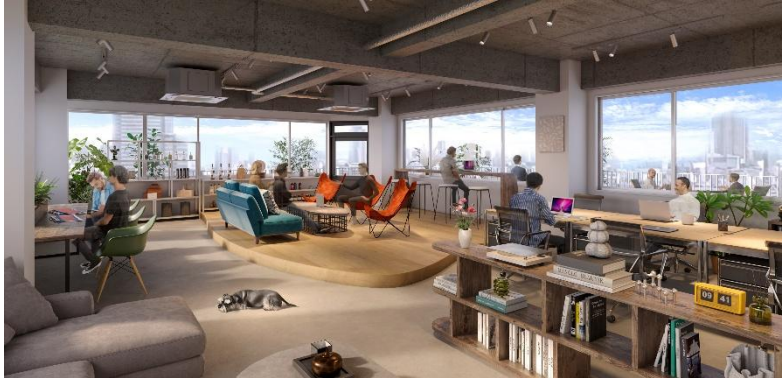
▲4F 専用テラス付きプレミアムオフィスイメージ

内は、三面採光による自然光が降り注ぐ、天井高 3.5m の開放的な空間です。専用の水回りを備えるほか、区画内の内装造作にも対応しており、企業のアイデンティティを反映した自由度の高いワークスペースを構築できます。