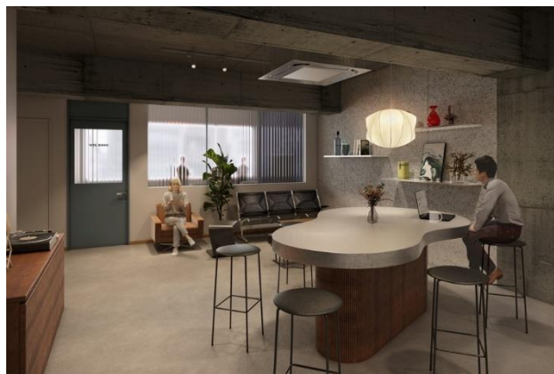
▲2F 共用ラウンジイメージ