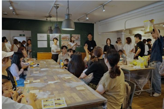
▲他物件で行ったワークショップの様子