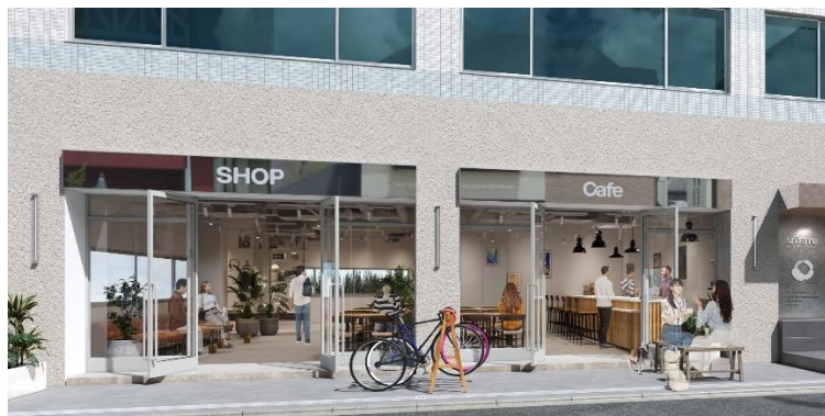
▲1F ショップ区画外観イメージ

路面沿いの1Fには、全3区画のショップスペースを配置。現在募集中の2区画は、飲食店舗やギャラリー、ショールームなど、さまざまな用途に対応します。専用のオープンテラスによって、店舗の賑わいが外へ自然に広がる、開放的な空間を演出します。※2区画セットでのご利用も可能です。