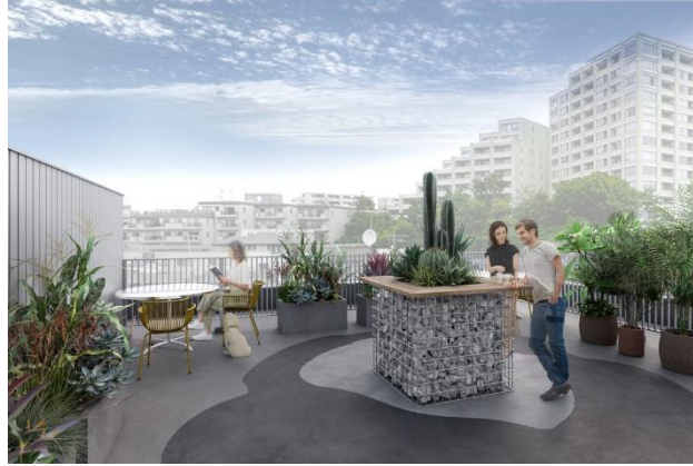
▲4F ルーフトップテラスイメージ

当施設では、ルーフトップテラスを含む全ての専有部内で愛犬・愛猫の同伴が可能です。場所の制約にとらわれることなく、ペットと共に過ごせる自由で豊かなワークスタイルを提案します。