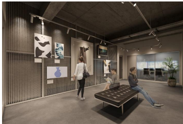
▲1F アートギャラリーイメージ

アートや展示を楽しめるだけでなく、入居者や近隣住民、ゲストが自由に行き交う、街に開かれた空間として、施設と街をゆるやかにつなぎます。日々のワークライフの中で多様な人や表現に触れることで、新たな視点や発想、インスピレーションを育みます。