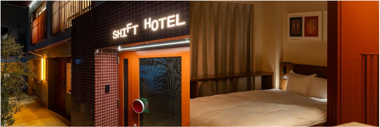
ホテルプロジェクト第一弾「SHIFT HOTEL Shibuya Hatagaya」外観・客室

客室は、家族や友人同士など大人数での宿泊にも対応できる広さがあり、キッチンや洗濯機も備え、中期滞在向けの設備も充実しています。観光やビジネスでの利用など多様なシーンに応じた客室タイプを用意し、都市での新しい滞在体験を提供します。