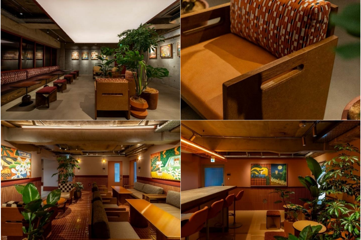
各階に配置した共用ラウンジ

2Fから4Fの入居者専用ラウンジのデザインは、「継ぐ素材」をコンセプトとし、長く愛された建物の歩みや造形を受け継ぎ、新しい時代に繋いでいくという想いが込められています。各階で木と鉄など幡ヶ谷の空気感に似合う、普遍的で味が出る素材に、人が手を加えながらデザインを継ぎ足し、長く経年変化を味わうことができる空間となっています。