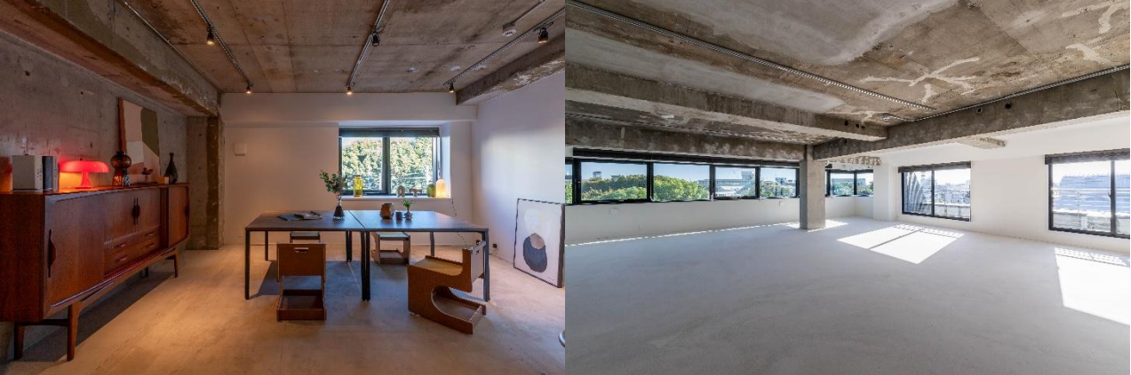
オフィス区画内装

オフィス区画内とルーフトップでは、入居者が愛犬とともに過ごせるペットフレンドリーな空間となっており、多様な働き方にフィットするシェアオフィスです。