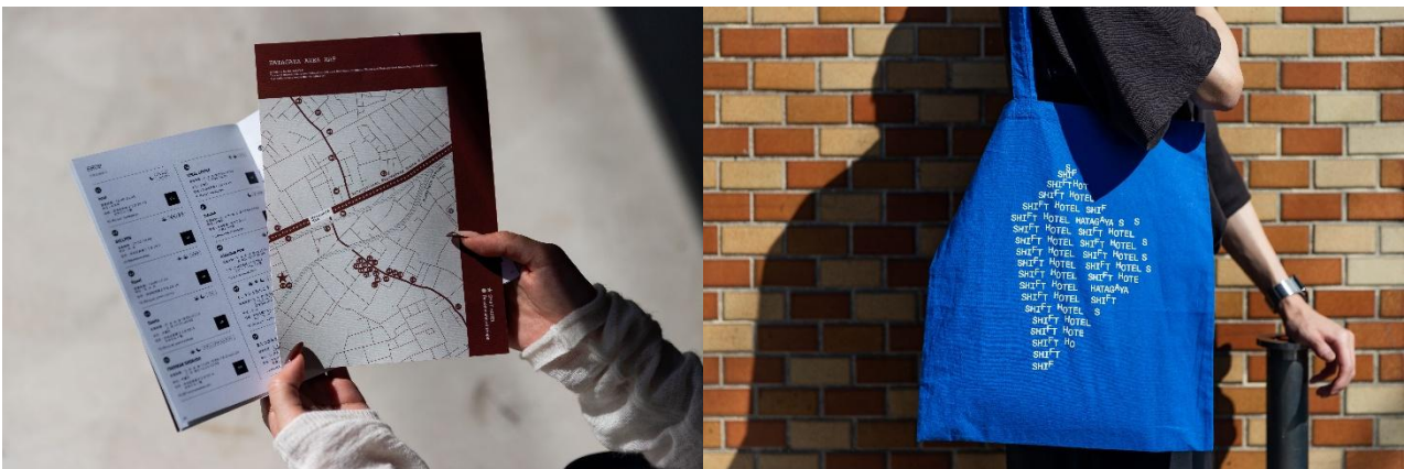
幡ヶ谷の飲食店やショップを紹介する「幡ヶ谷マップ」／オリジナルのトートバッグ

「SHIFT HOTEL」WEB サイト： https://shift-hotel.com/