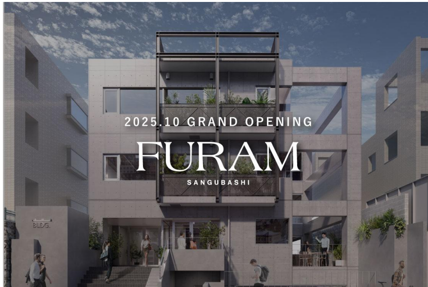
▲FURAM SANGUBASHI 外観イメージ

■公式サイト： https://ordermade-tokyo.jp/lp/furam/