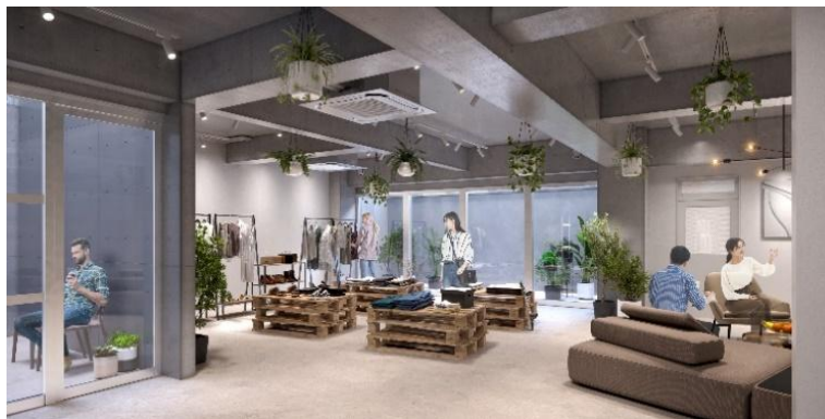
▲B1F 区画 サービスショップ入居イメージ

前面道路から直接アプローチが可能な、B1F 区画はサービスショップや事務所、ショールーム等としてご利用いただけます。内装は必要最低限のインフラ設備を備えたシンプルな仕上げで、自由に空間のカスタマイズが可能です。専用テラスとドライエリアを設けており、地下でありながらも自然光が差し込む、心地の良い空間となっています。