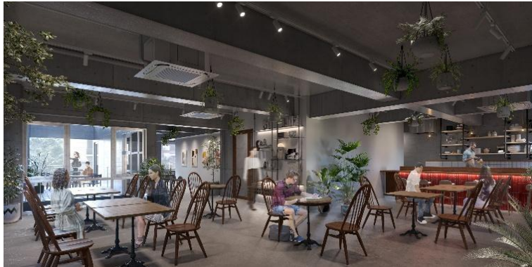
▲1F 区画 飲食店舗入居イメージ

された専用テラスには屋外席の設置も可能で、地域との繋がりを活かした店舗運営にも活用いただけます。用途に応じて、専用駐車スペース（有料）もセットでご利用可能です。