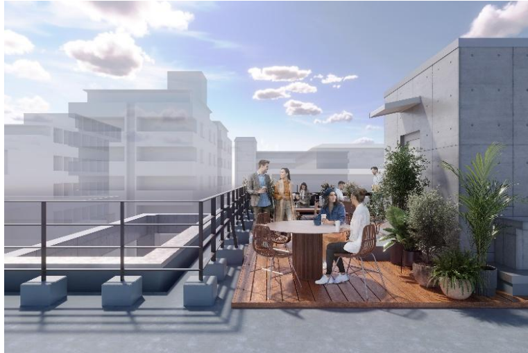
▲3F 専用ルーフトップイメージ