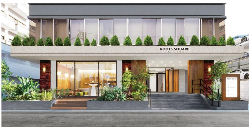
▲ROOTS SQUARE IKEJIRIOHASHI 外観イメージ