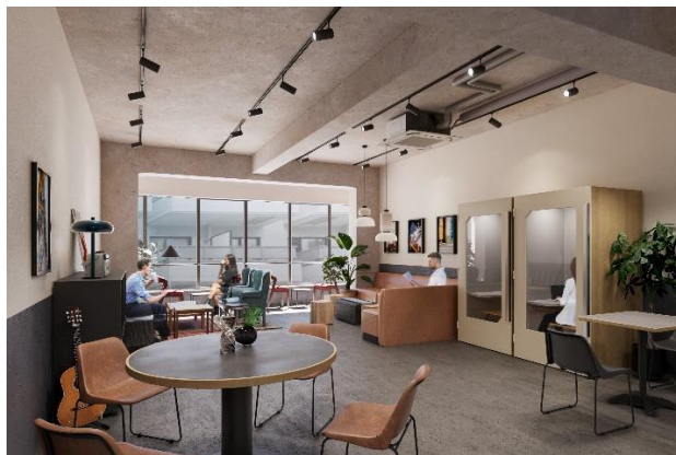
▲3F ラウンジイメージ

3F 入居者専用のラウンジでは、今年 7 月に再開発による建替えとなってクローズしたリアルゲイト運営物件「PORTALPOINT YURAKUCHO」の家具をピックアップし再利用。いつの時代でも色あせない魅力を持つ普遍的なデザインの家具が新しい施設のラウンジを彩ります。