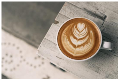
▲BYRONBAY coffee 大門口