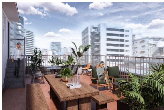
▲ルーフトップテラスイメージ

屋上にあるルーフトップテラスではゆったりと寛げるスペースを設け、外気を浴びながらのランチミーティングや気分転換の為のリフレッシュも可能。社内外のコミュニティスペースとしてご活用いただけます。