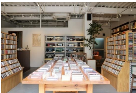
▲中目黒にある waltz の店舗