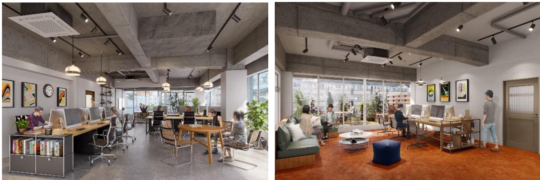
▲3階専有部／4階専有部イメージ

3階には3面ガラス張りの開放的な区画もあり、全10区画と小規模ながらバリエーションに富んだ区画をご用意しております。