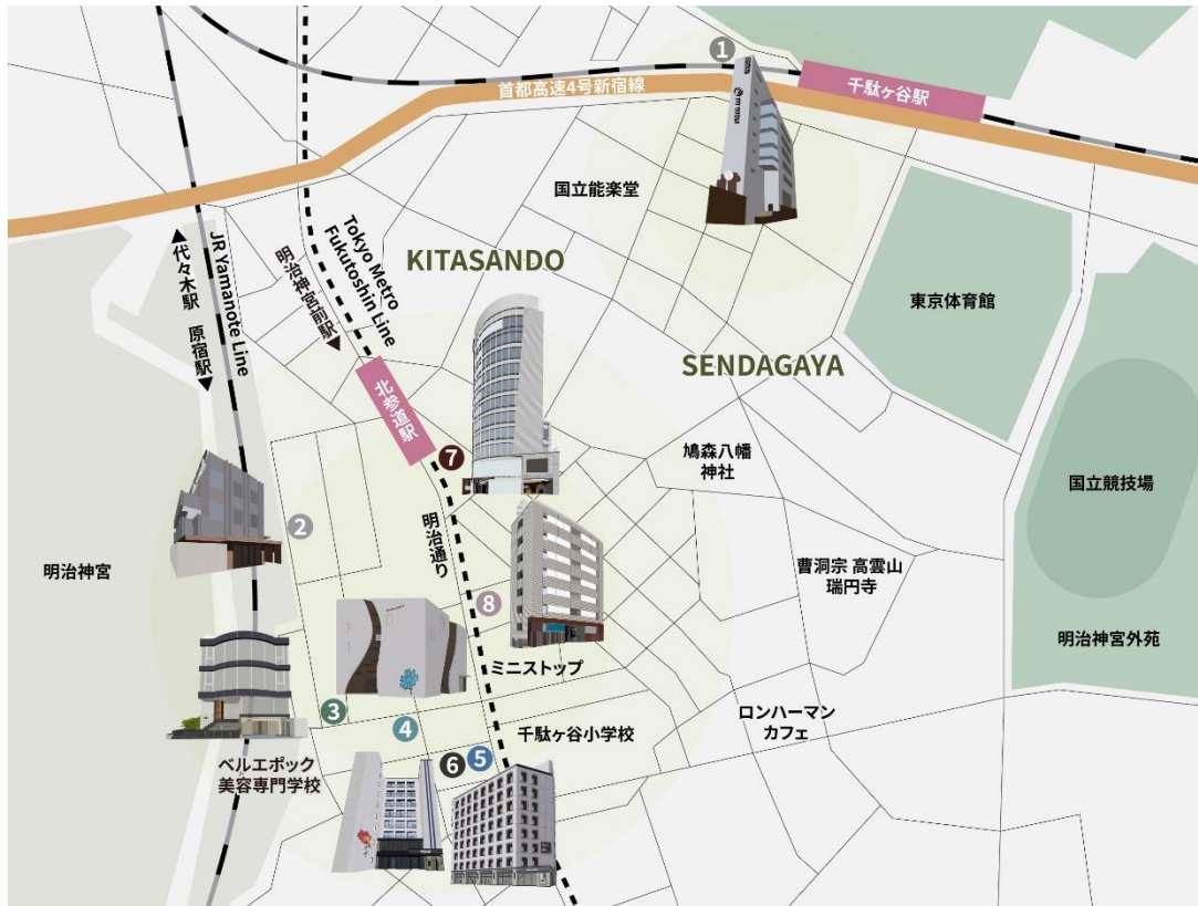
▲千駄ヶ谷・北参道エリア リアルゲイト企画・運営物件

建物の個性を大切にしながら新たな息吹を吹き込みプロデュースする物件はどれ一つとして同じものではなく、エリア特性やニーズを総合的に捉え、個性的な建築物を特定エリアに点在させることで、人が集まるスポットを作り、街全体にさらなる活気を生みます。