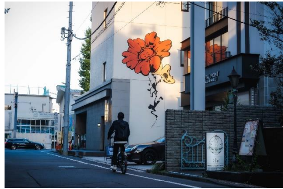
▲REALGATE Bldg. / PORTAL POINT HARAJUKU ANNEX 外壁に描かれるポタンフラワー

こうしたエリア一体開発は、渋谷、中目黒・池尻エリアでも展開をしており、中目黒・池尻エリアでは2014年にオープンしたクリエイティブオフィス、レストラン、コーヒースタンドからなる複合施設「THE WORKS」の第3弾シリーズとしてTHE WORKS CROSSを3月にオープン。(中目黒・池尻エリア8棟目)