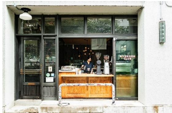
▲2014年のオープン以来、クリエイターの活動拠点として支持を集める THE WORKS